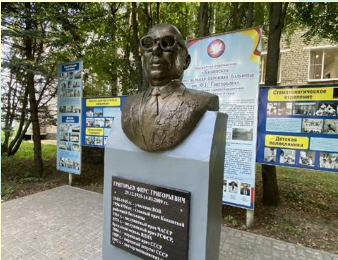
На территории больницы установлен бюст Ф. Г. Григорьева